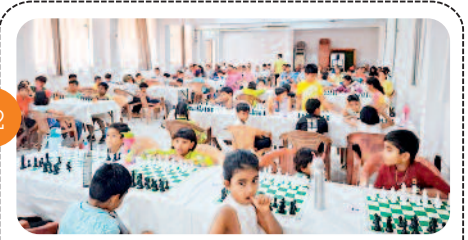
नन्हे मोहरों की बिसात पर सजी बुद्धिमत्ता...