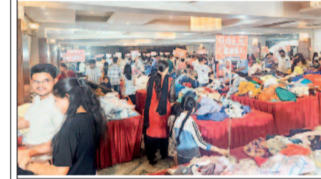
स्टॉक को तेजी से निकालना और ग्राहकों को किफायती दरों पर ब्रांडेड उत्पाद उपलब्ध कराना है। यह सेल आज भी रहेगा। ग्राहक सुबह 10 बजे से आकर अपने पसन्द के ब्रांड के कपड़े कम दाम में खरीद सकते हैं।

भिलाई। चौहान एम्पूरियन होटल में आयोजित स्टॉक क्लियरेंस सेल ने भारी संख्या में ग्राहकों को आकर्षित किया है। कंपनियों के पास अतिरिक्त स्टॉक जमा हो जाने के कारण यह विशेष सेल आयोजित की गई, जिसमें ग्राहकों को 90% तक की छूट दी जा रही है। यह सेल तीन दिनों के लिए आयोजित की गई है, जिसमें विंटर और समर गारमेंट्स, फुटवियर और होम डेकोर उत्पादों पर भारी डिस्काउंट मिल रहा है। सेल में लगभग 100 से ज्यादा राष्ट्रीय और अंतरराष्ट्रीय ब्रांड्स के उत्पाद एक ही स्थान पर उपलब्ध कराए गए हैं। पुरुषों के कपड़ों पर 199 से 999 तक, महिलाओं के परिधानों पर 199 से 499 तक और बच्चों के कपड़ों पर 199 से 299 तक के आकर्षक ऑफर दिए जा रहे हैं। वहीं, ब्रांडेड फुटवियर और होम डेकोर आइटम भी आधी कीमत तक उपलब्ध हैं। आयोजकों का कहना है कि इस तरह की सेल का उद्देश्य अतिरिक्त कम से कम डायन पेमेंट के साथ फाइनेंसिंग और एक्सचेंज की सुविधाएं भी उपलब्ध हैं।