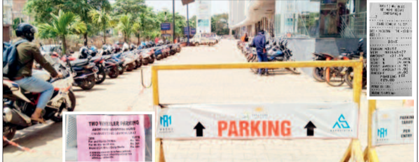
अस्पताल से मॉल तक आम लोगों पर अतिरिक्त बोझ

चिंता की बात यह है कि अस्पताल जैसे संवेदनशील स्थानों पर भी मरीजों और उनके परिजनों से पार्किंग शुल्क वसूला जा रहा है। इलाज के लिए पहले ही आर्थिक दबाव झेल रहे लोग इस अतिरिक्त खर्च से और परेशान हो रहे हैं। मॉल में भी हालात कुछ अलग नहीं हैं। खरीदारी करने पहुंचे लोगों से पार्किंग चार्ज लिया जा रहा है, जबकि कई जगहों पर इसे सुविधाओं में शामिल माना जाता है। लोगों का कहना है कि जब वे मॉल में खरीदारी कर रहे हैं, तो पार्किंग के लिए अलग से पैसे लेना उचित नहीं है। इस बीच रायपुर में उपभोक्ता फोरम द्वारा एक मॉल पर पार्किंग शुल्क वसूलने को लेकर कड़ी कार्रवाई और भारी जुर्माना लगाए जाने के बाद अब दुर्ग-भिलाई में भी ऐसी ही कार्रवाई की मांग तेज हो गई है। स्थानीय लोगों और सामाजिक संगठनों का कहना है कि जिला प्रशासन को इस मामले में स्पष्ट नियम तय करने चाहिए और अवैध वसूली पर सख्त कदम उठाना चाहिए। खासकर अस्पतालों में पार्किंग शुल्क को लेकर अलग से दिशानिर्देश जरूरी बताए जा रहे हैं। कानूनी जानकारों के अनुसार, यदि कोई संस्थान बिना उचित अनुमति या नियमों के पार्किंग शुल्क वसूल रहा है, तो यह उपभोक्ता अधिकारों का उल्लंघन माना जा सकता है।